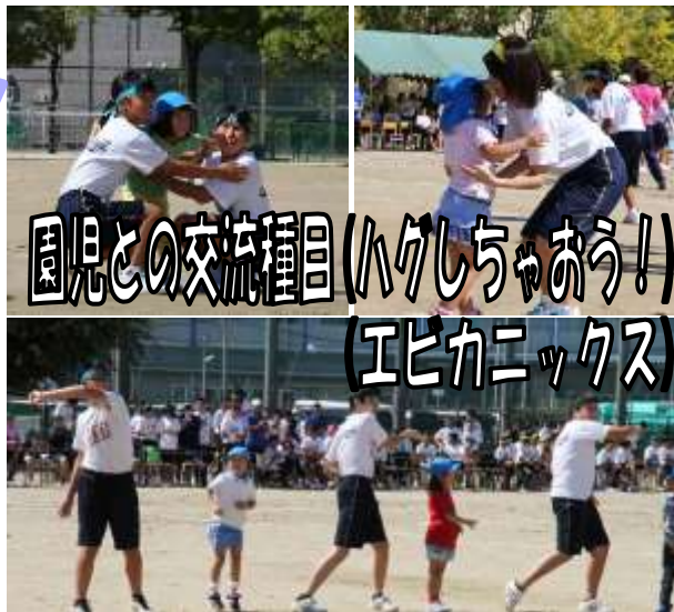
園児との交流種目 (ハグしちゃう!!) (エビカニックス)

9月29日(金)に第37回体育大会がありました。生徒たちはクラスで団結して一生懸命頑張っていました。また、各係の生徒たちも自分の役割を責任持って果たすことができました。次の音楽コンクールも各クラスが団結して素晴らしい行事にしてほしいと思います。