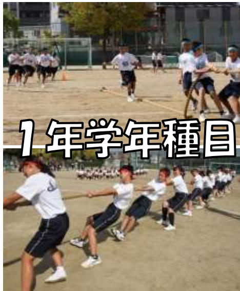
1年学年種目 (加勢綱引き)