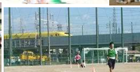
ドクターイエローに負けるぞ!